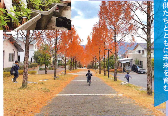
2025年度 住まいのまちなみ賞 みどり坂町内会(広島県広島市安芸区)