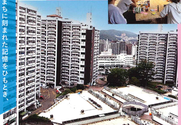
2025年度 住まいのまちなみ賞 6コア自治会(広島県広島市中区)