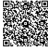
フェイスブックページ